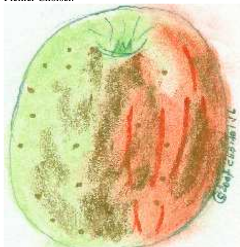
Pastel Choisel Jean-Louis 2007©